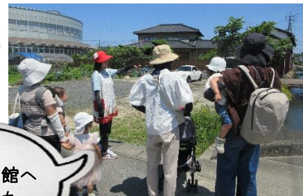
船穂図書館へ行きました。

★おもちゃ・扉の持ち手等、「クリアパルス殺菌システム」により、殺菌をしています。